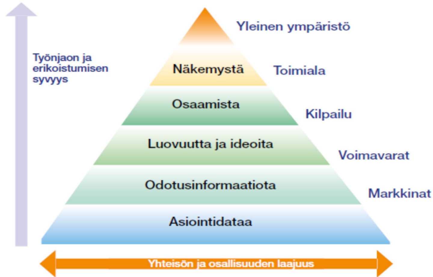
Kuvio 5. Omistajayhteisö sopeutumisen ja innovaatioiden edistäjänä.